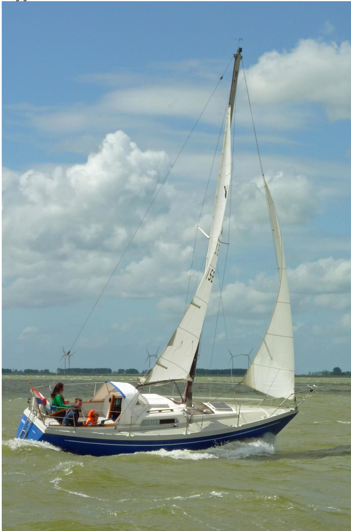
afb. 3 V822 1978 bouwnr. 26 'Jsvogel' 07-2012