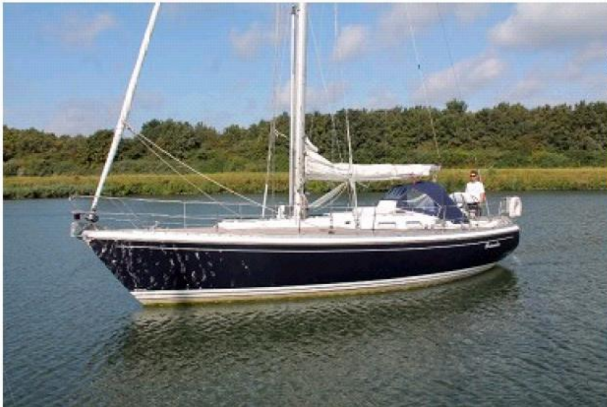
afb. 3 V1122 1998, bouwnummer 27, 2012