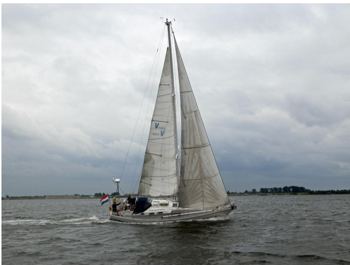
afb. 2 V1122 1994 bouwnr 1, 07-2013