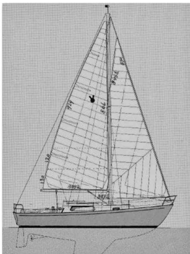
afb. 2 Vue de côté finkeel (après 1970)