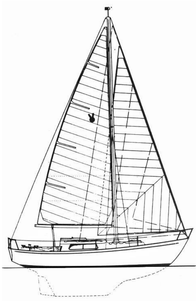
afb. 1 Vue de côté quille longue