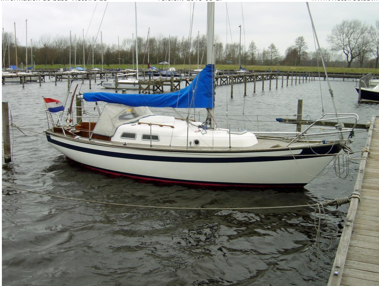
afb. 7 la dernière V28 1990, numéro inconnu, (photo 03-2003)