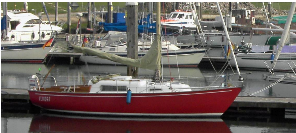
afb. 6 V28 1974 numéro 69 'Vlinder' - (photo 10-2012)