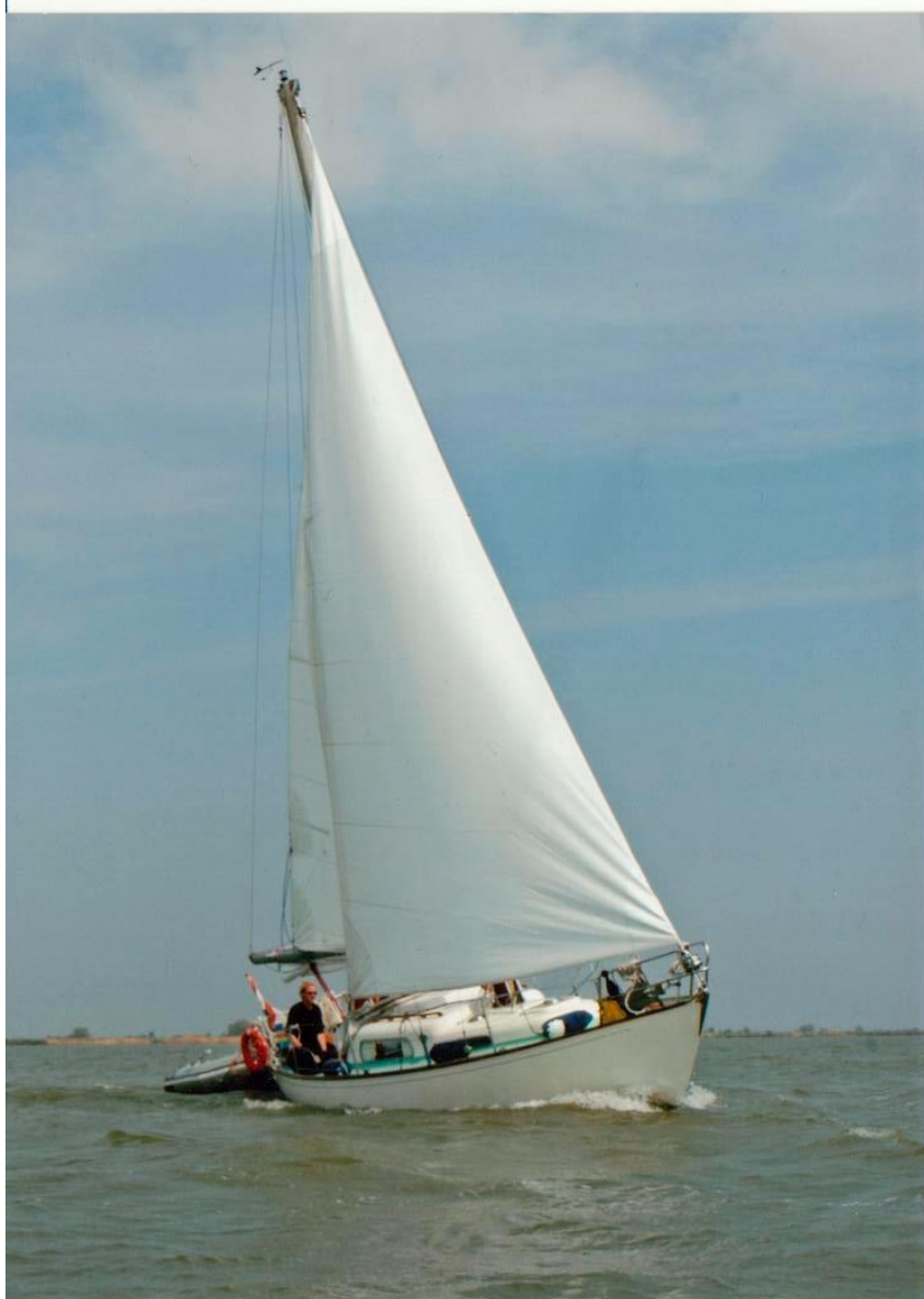
abb. 5 V28 langkiel bouwnr onbekend 'Twaan'