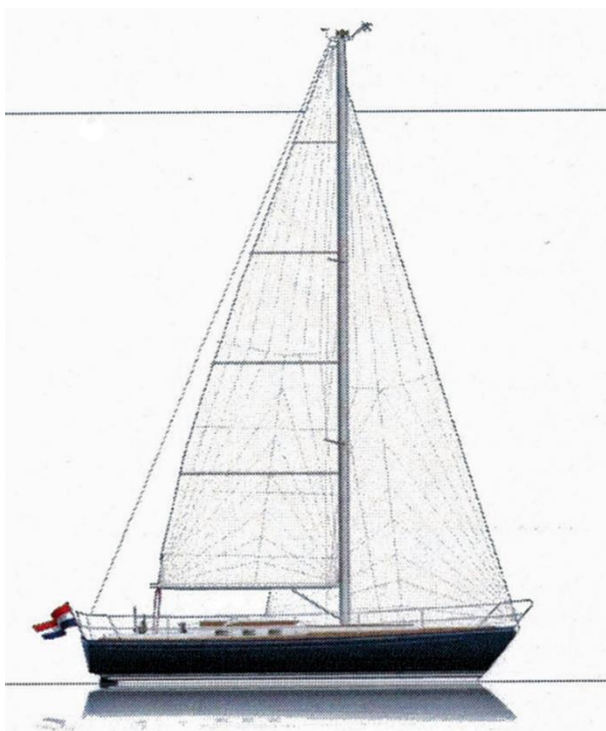
afb. 3 Zijaanzicht