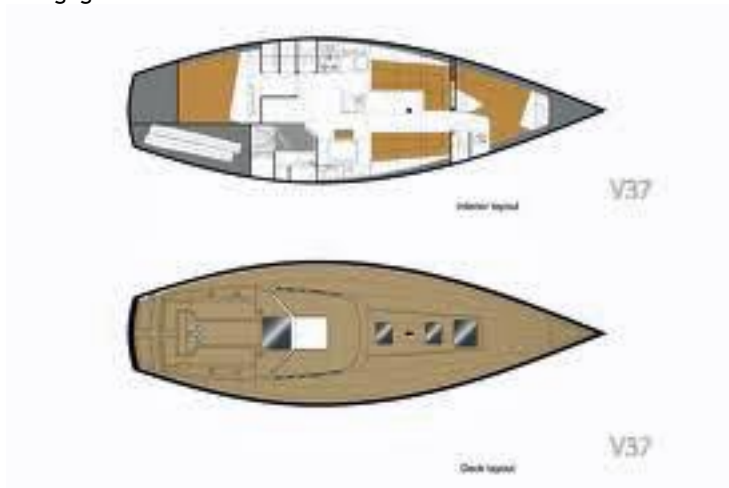
afb. 1 Bovenaanzicht binnenindeling en dekindeling