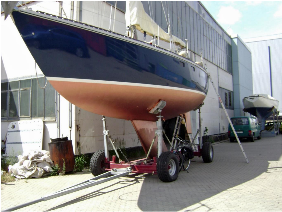
afb. 3 Op de wal (foto 07-2008)