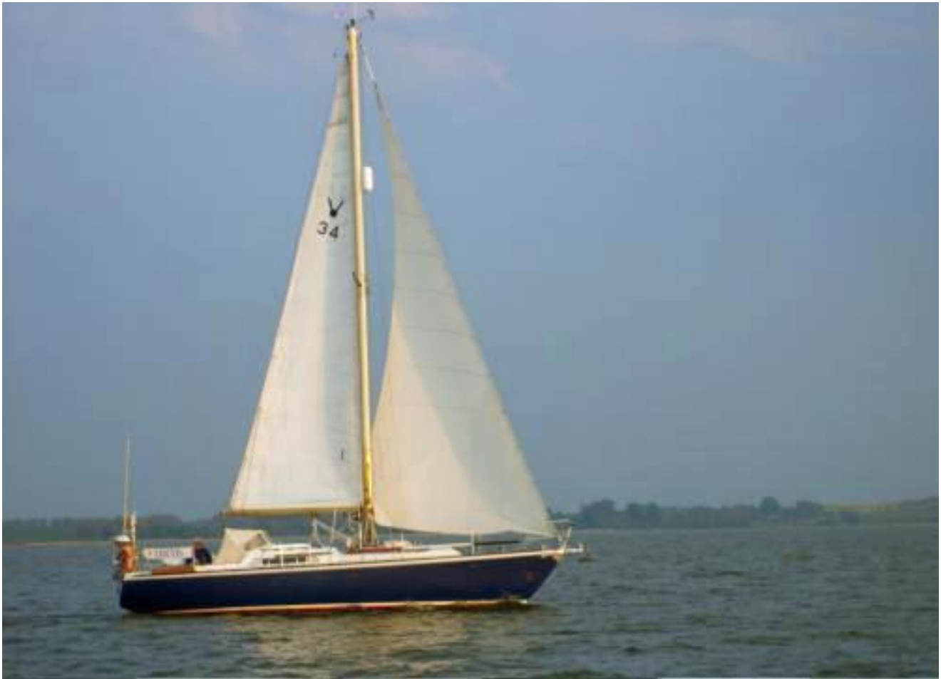
afb. 1 Onder zeil (foto 05-2006)