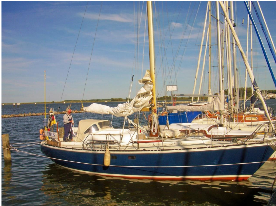
afb. 2 Zijaanzicht (foto maand-jaartal)