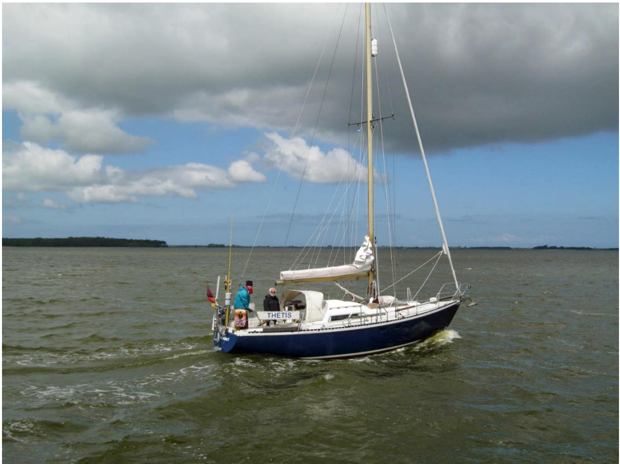
afb. 4 Onder zeil (foto 05-2015)