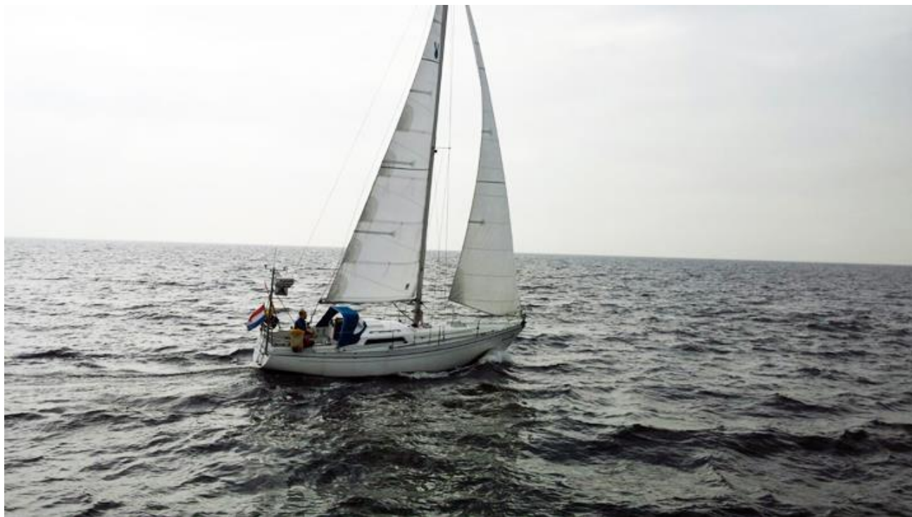
afb. 1 Onder zeil (foto 2016)