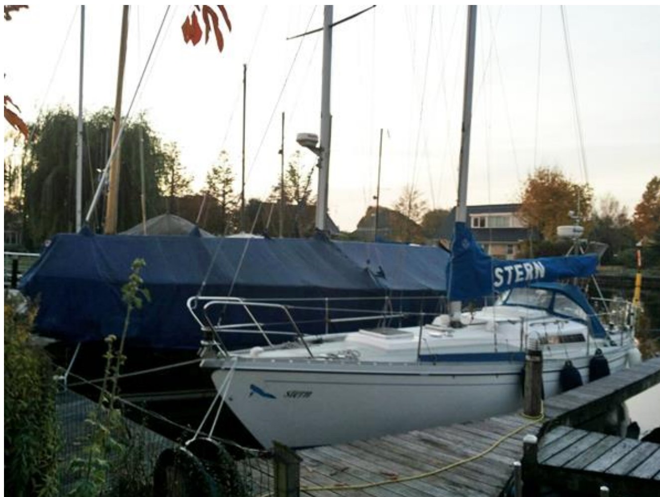
afb. 2 Zijaanzicht BB (foto 2015)