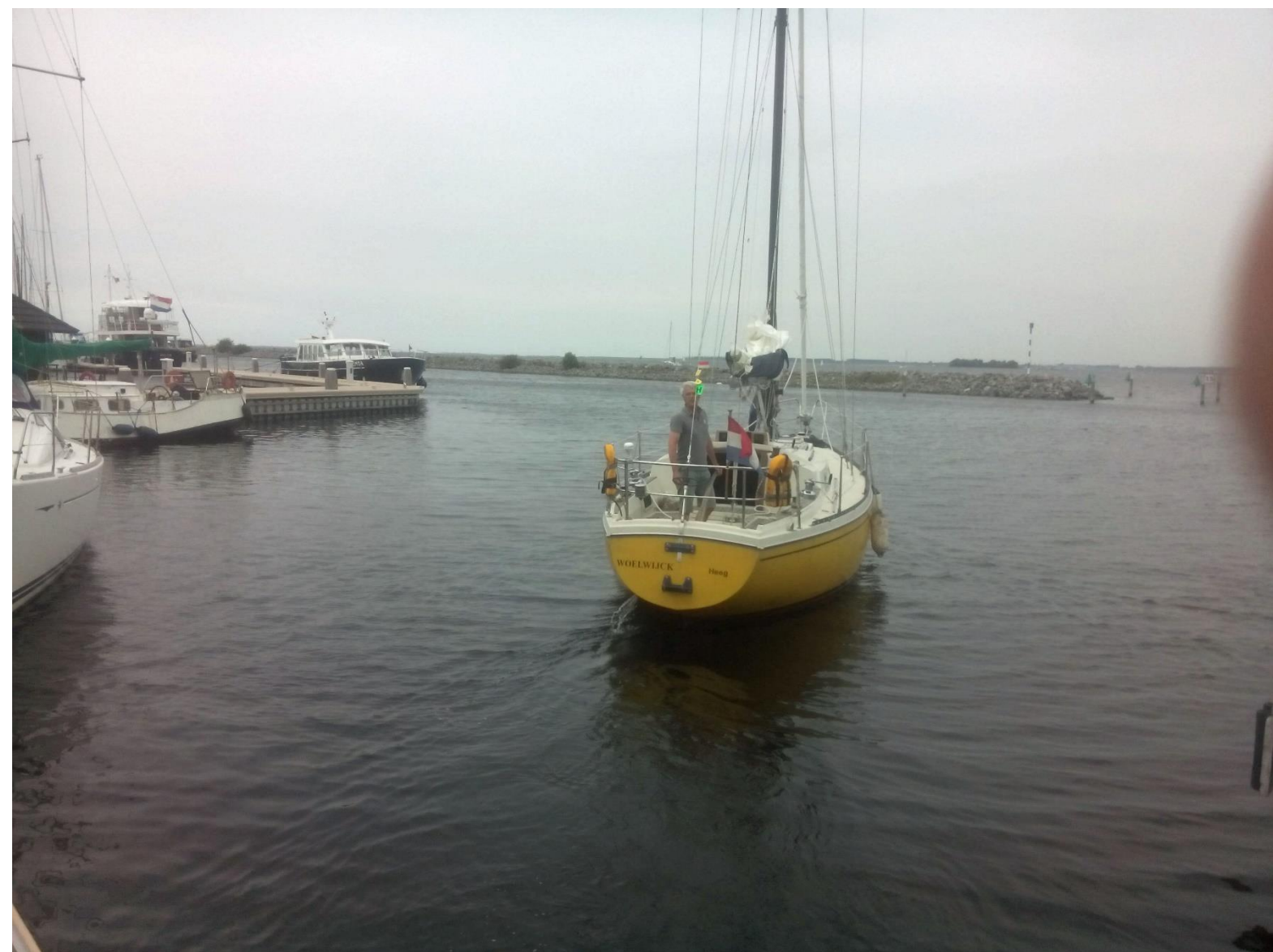
afb. 1 Achteraanzicht (foto 07-2015)