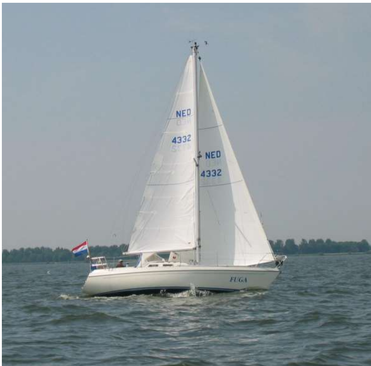
afb. 2 V855 1989 bouwnr. 7, 'Fuga', foto 05-2003