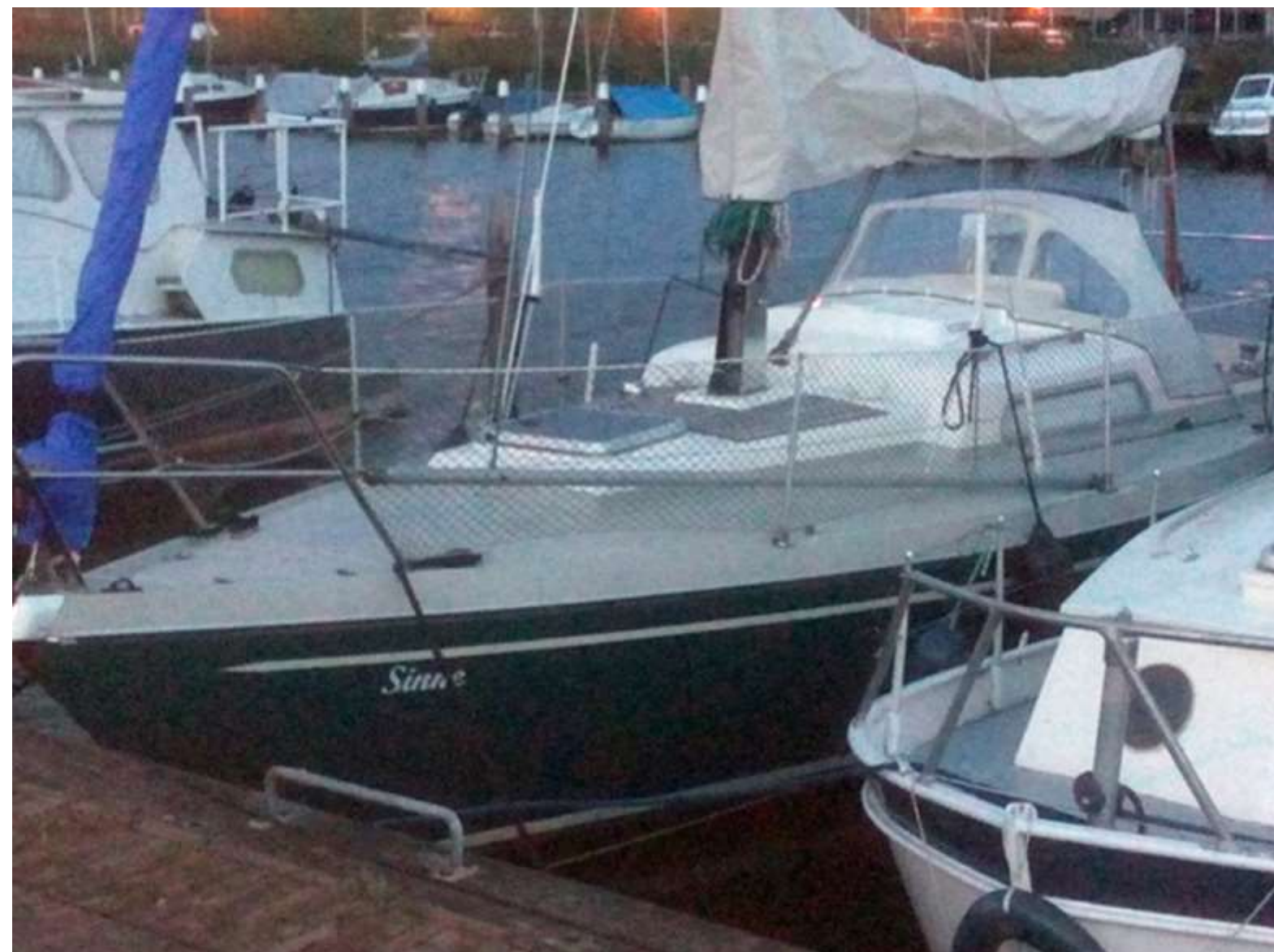
afb. 1 Zijaanzicht BB (foto 08-2014)